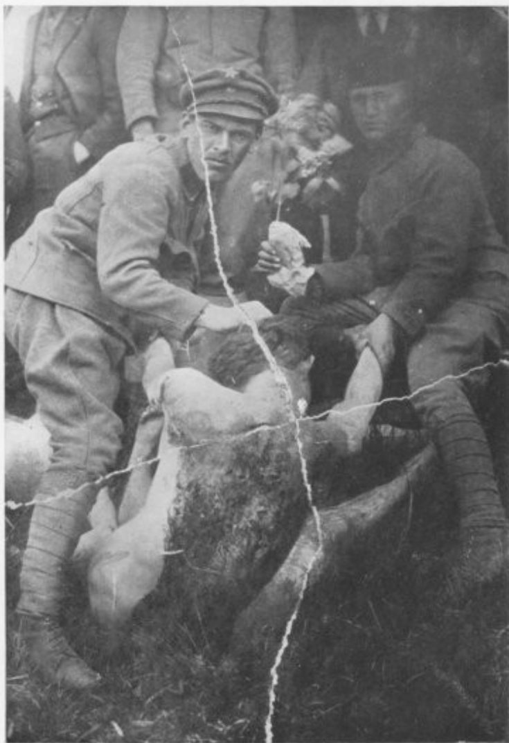
TERRORISTS WITH A VICTIM WHOM THEY HAVE FLAYED AND TORTURED TO DEATH. (This photograph was found at their headquarters.)