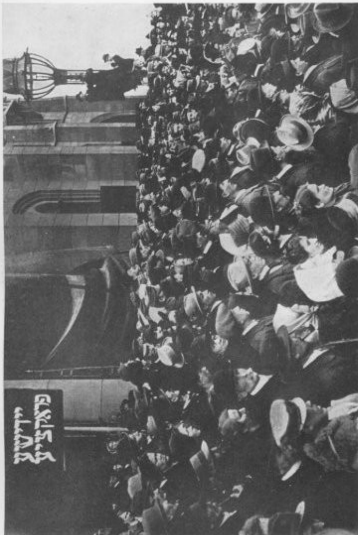
THE JEWS CALL A MEETING AND DECIDE TO ORGANISE A JEWISH RED REGIMENT TO FIGHT FOR BOLSHEVISM.