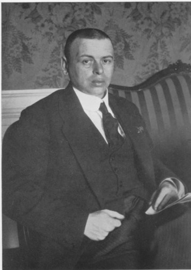
BELA KUN (KOHN).