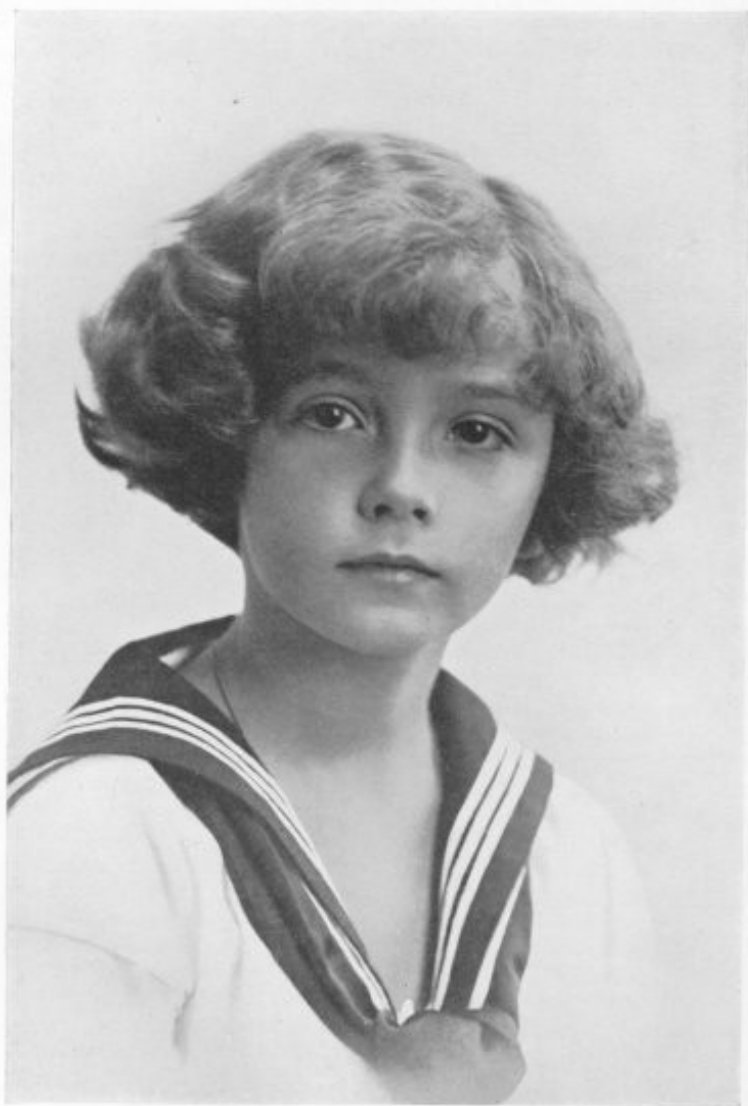
THE CROWN PRINCE OTTO (de jure KING OF HUNGARY).