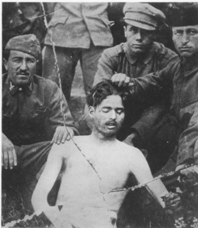
THE LENIN BOYS POSE FOR THEIR PHOTOGRAPH WITH THEIR VICTIM.