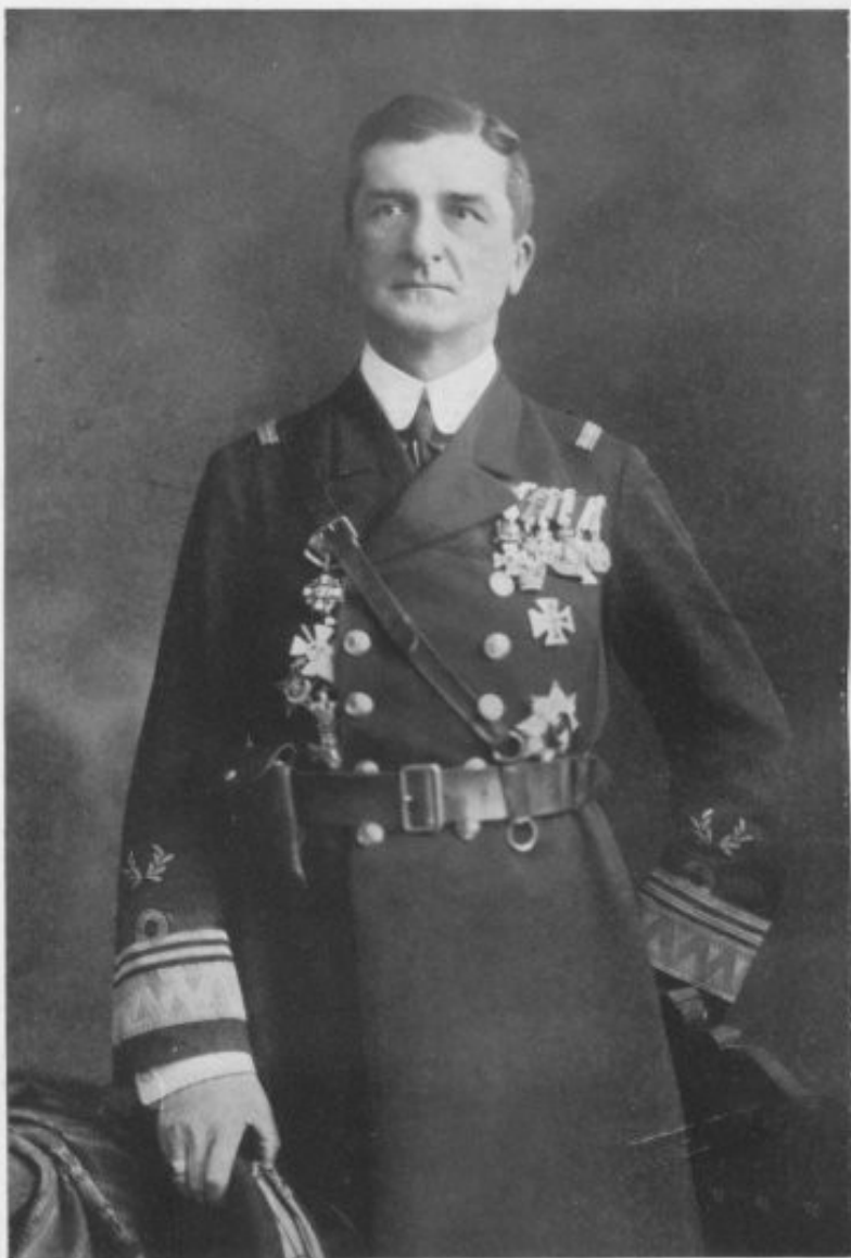
ADMIRAL NICHOLAS HORTHY.